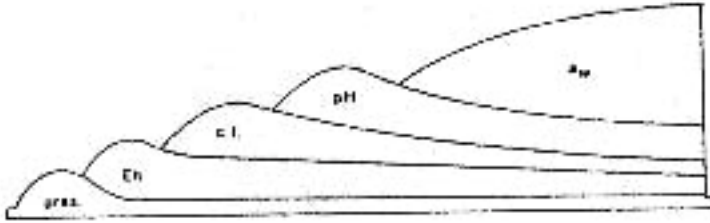
Şekil.2. Fermente çiğ sosisteki engeller teknolojisinin uygulanması

gıdalarda koruyucu etki yaptığı uzun yıllardan beri bilinmektedir. Ozon gazının bir kaç ppm düzeyinde kullanımının pek çok bozulma etmeni mikroorganizmaya karşı etkili olduğu belirlenmiştir. Ancak bu gaz kuvvetli bir oksidanttır (yükseltgeyici) ve yüksek oranda lipit içeren gıdaların korunmasında kullanılmamalıdır. Hem CO 2 hem de Ozon uzun süreli depolanan karkasların yüzeysel bozulmasını geciktirmede etkilidir.