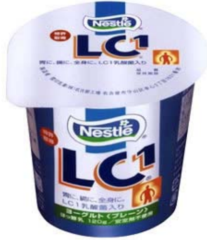
Şekil 3 Probiyotik yoğurt (26)